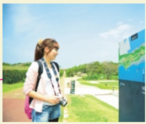
ไปทางนั้นะ