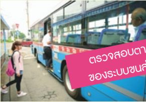
ตรวจสอบตารางของระบบขนส่งให้ดี

นอกจากตารางเดินเรือแล้ว อย่าลืมตรวจสอบตารางเวลาของรถไฟ รถไฟฟ้าตลอดจนรถประจำทางด้วย เพื่อความสะดวกในการเดินทางท่องเที่ยว พกสมุดเล่มเล็กๆ ที่บันทึกตารางเวลาเอาไว้ หรือพิมพ์เก็บไว้ในมือถือก็ได้