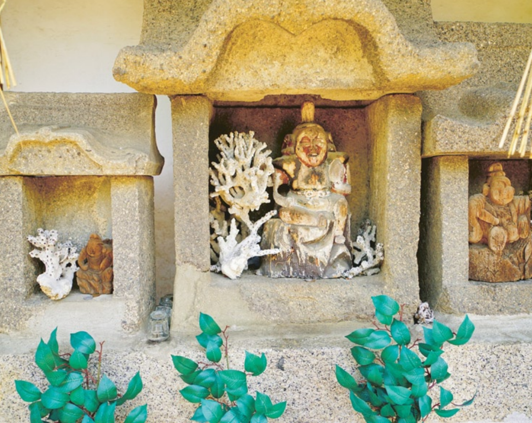
เกาะงิมะ จังหวัดกะงะวะ