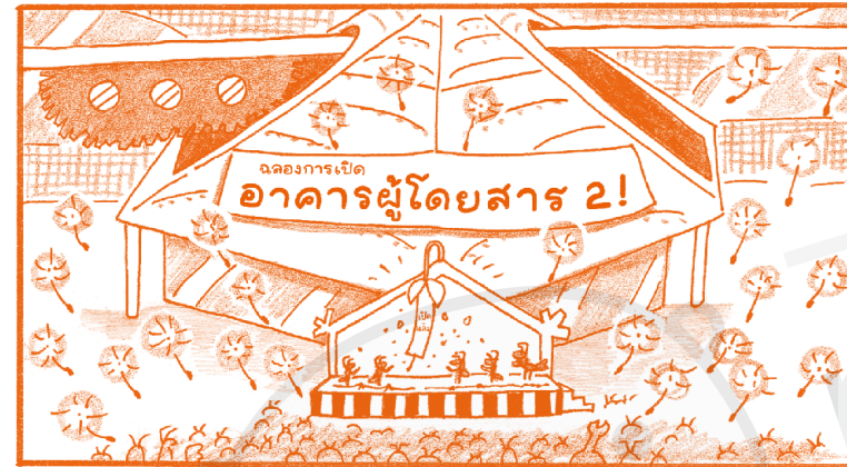
ภาพพิธีเปิดซึ่งมีเกสรดอกไม้ไปปลิวว่อนบริเวณด้านหน้าสนามบินโยแมงมุม