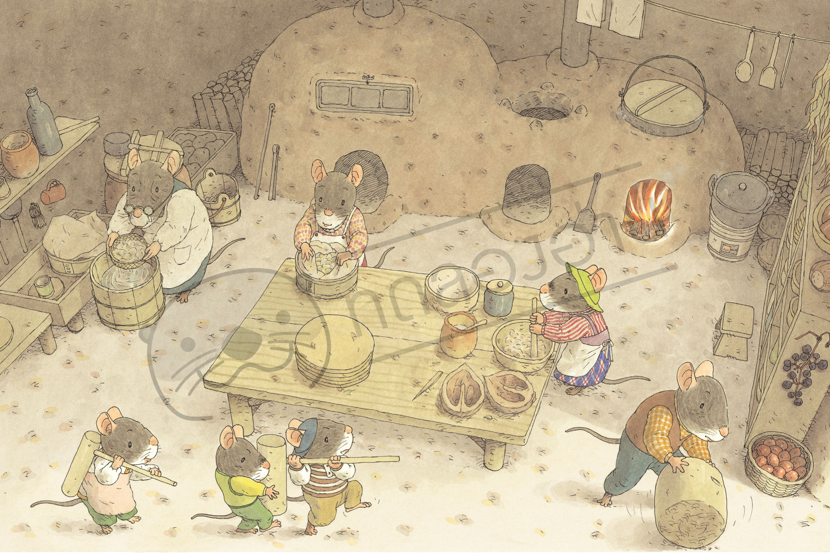
คุณยายสะเด็ดน้ำออกจากข้าวที่แช่น้ำไว้ตั้งแต่เมื่อคืน