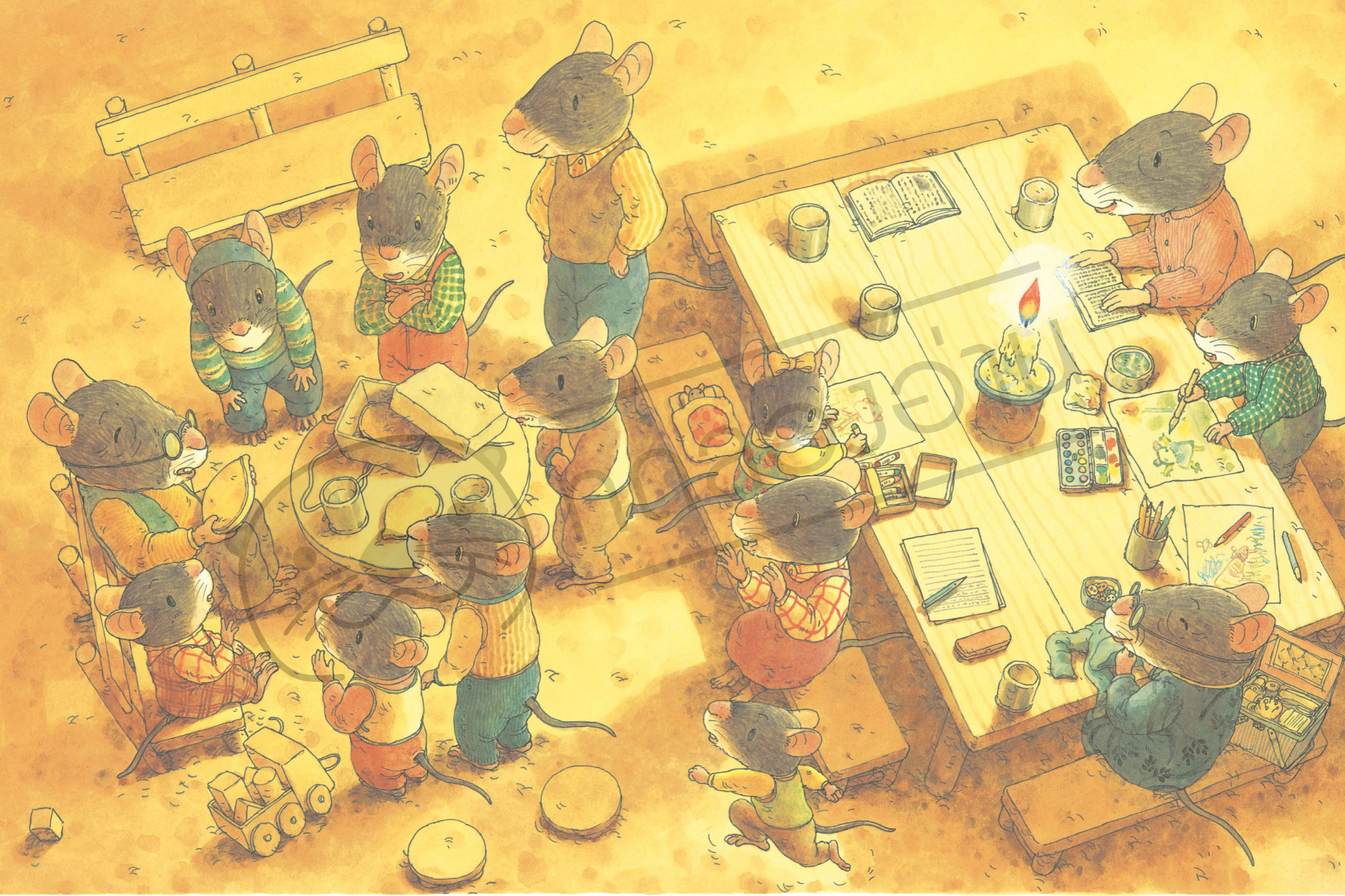
คุณตาบอกว่า นี่คือเมล็ดของฟักทอง ที่รอวันจะได้เจริญเติบโต