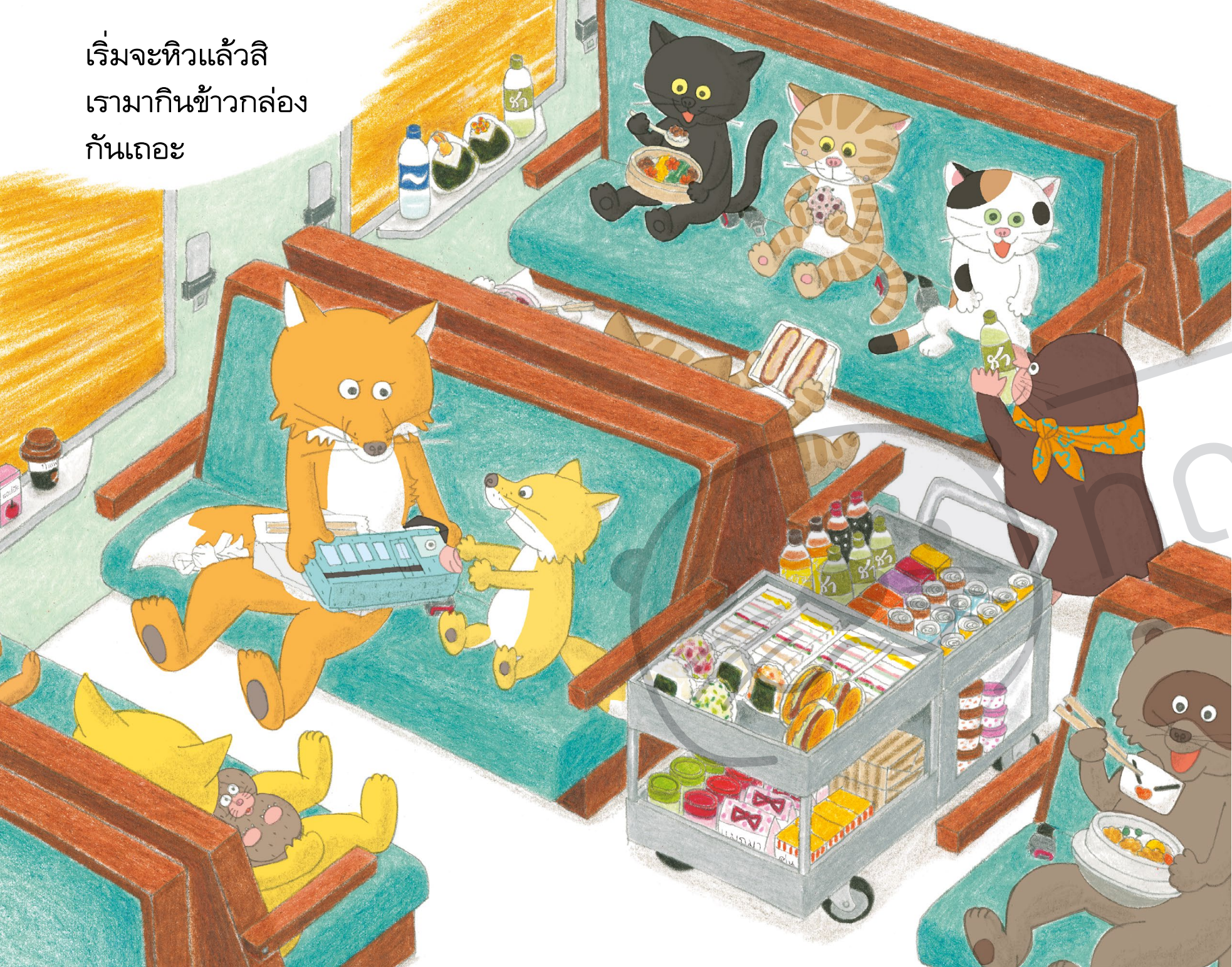
แซนด์วิชชั้นดิน

เริ่มจะหิวแล้วสิ เรามากินข้าวกล่อง กันเถอะ