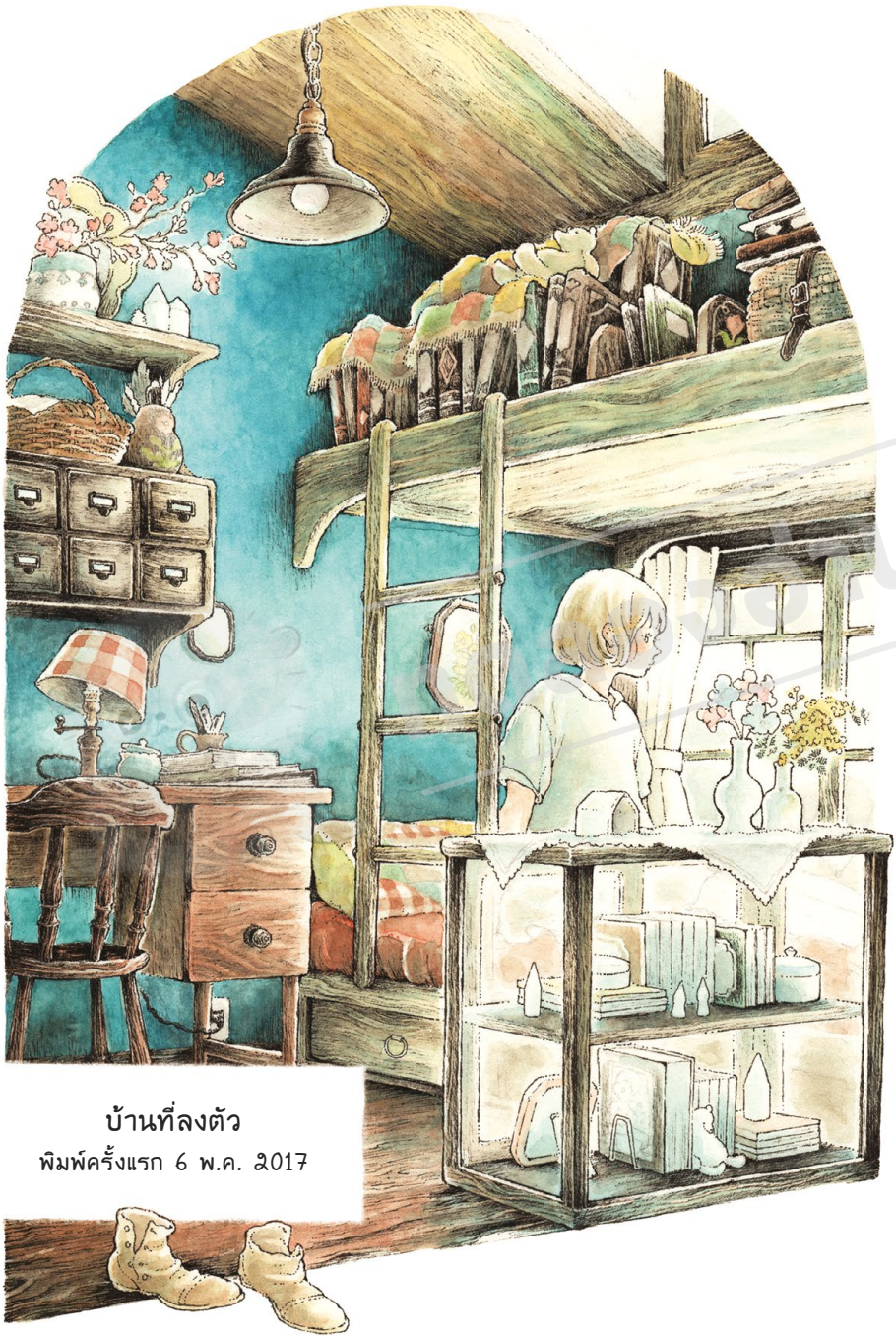
บ้านที่ลงตัว พิมพ์ครั้งแรก 6 พ.ค. 2017