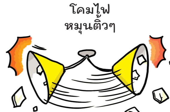
โคมไฟ หมุนติ้วๆ