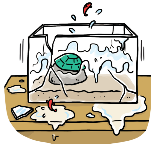
ตู้ปลาแตก ปลาทองกระโดด ออกมานอกตู้