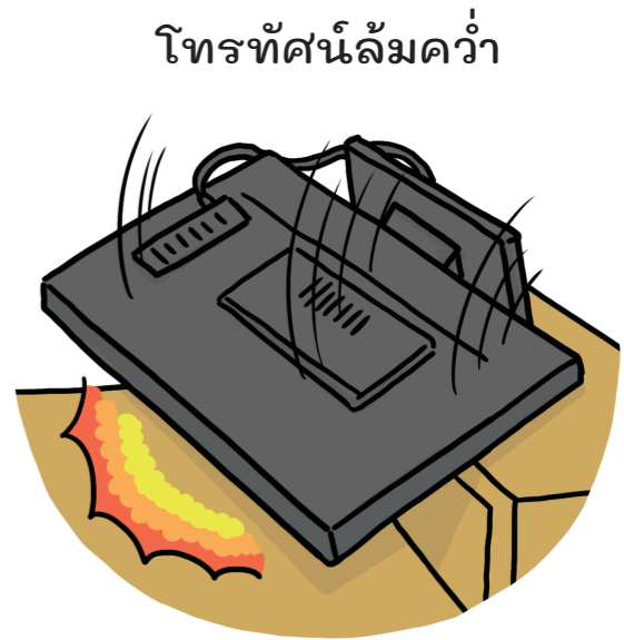
โทรทัศน์ล้ามคว่ำ